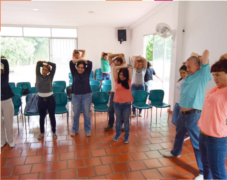
Encuentro de compañerismo por departamentos.